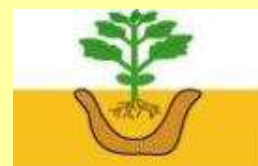
定植時 植穴土壌混和