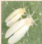
タバココナジラミ

対策 ▶発病株は圃場外へ適切に処分する ▶余分な下葉はかきとる ▶適切な肥培管理を行う