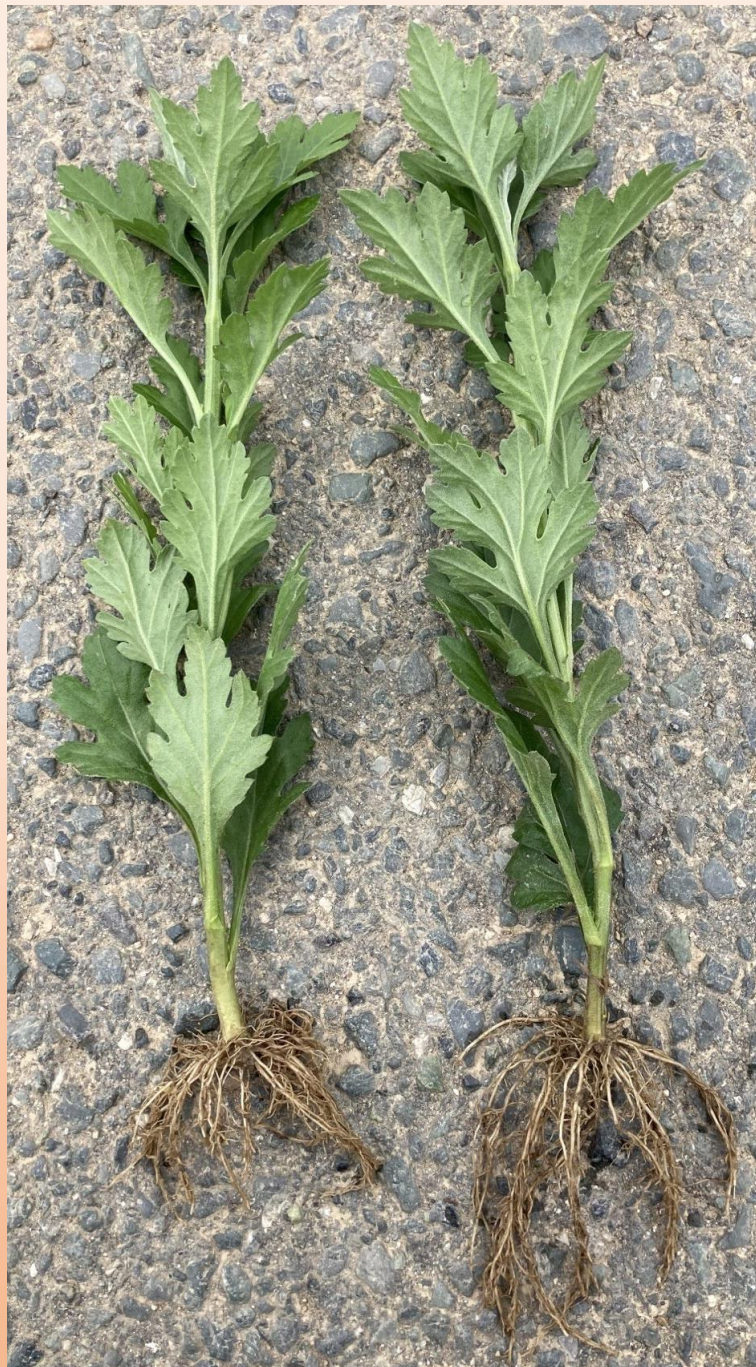
1,000倍希釈 葉面散布 全体