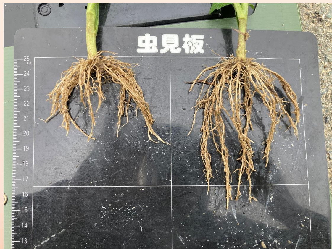
1,000倍希釈 葉面散布 発根の様子